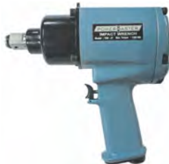
TIW - 27