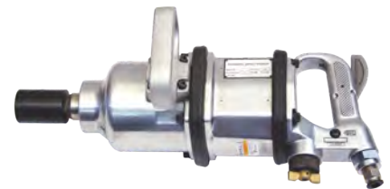
TIW - 76