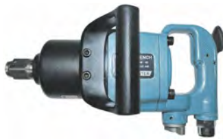
TIW - 48