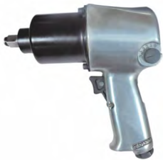
TIW - 16